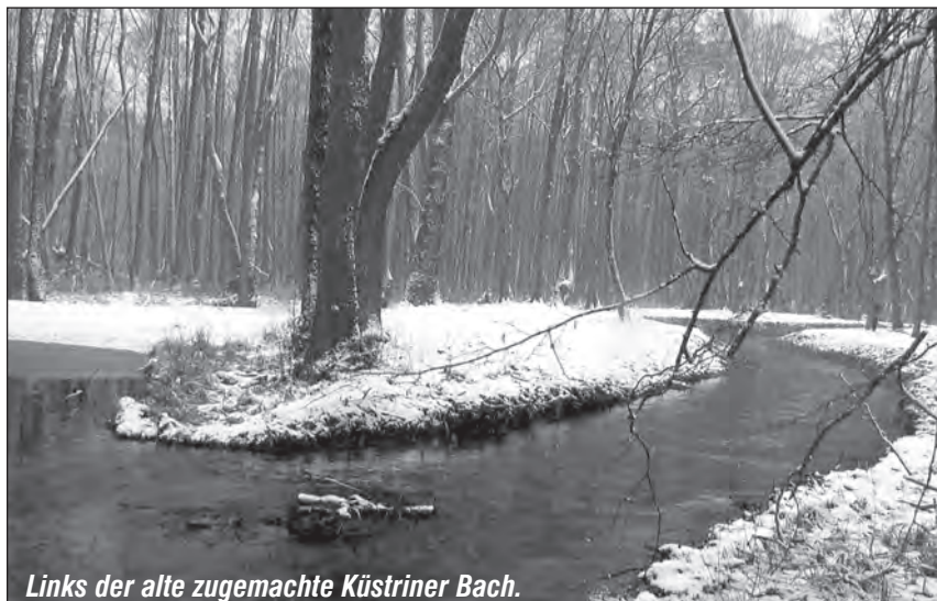
Links der alte zugemachte Küstriner Bach.