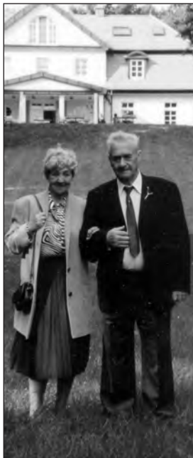
Goldene Hochzeit 1997.

Holzeber mit Sitz in Eberswalde und fängt wieder als Brigadier im Hohenlychener Werk an. Zuerst wird das Anschlussgleis repariert. Er übernimmt die Leitung des Betriebes und erhält als ersten Auftrag, 234 Waggon Schnittholz (6000 Kubikmeter) auszuladen, zu pflegen und wieder nach Ungarn zu verladen. Immerhin kommen bei dieser Aktion 50 Lychener in Lohn und Brot. Nebenbei wird schon ein 1-Gatter-Sägewerk aufgebaut mit Lokomobile, Transmissionswellen und Kreissäge. Im September 1950 schnei-