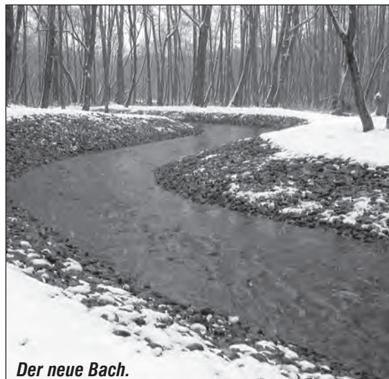
Der neue Bach.

Mit Erschrecken mussten wir auf einer Winterwanderung zum Küstriner Bach feststellen, welche Veränderungen hier erfolgt sind. Hatte man schon vor einiger Zeit einen Umgehungskanal an der Schleuse gebaut, so ist mittlerweile davor ein großer See entstanden.