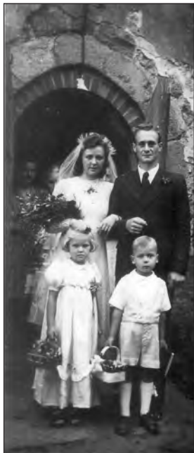
Hochzeit 1947.